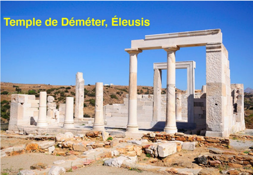
Temple de Déméter, Éleusis

Les Mystères d'Éleusis , célébrant Déméter et Perséphone, offraient déjà la vision d'un salut réservé à ceux qui avaient « vu » les choses sacrées. D'autres cultes – ceux d' Isis , de Cybèle , de Mithra ou de Dionysos – multiplient à leur tour les voies d'accès à la béatitude.